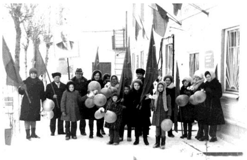
На демонстрации, 1974 г.