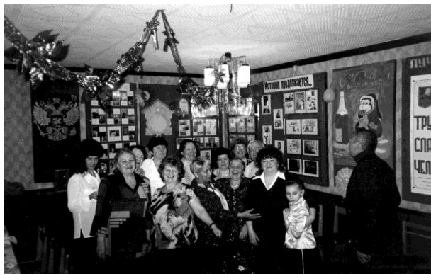
В день празднования 40-летия БПК, 2003г.