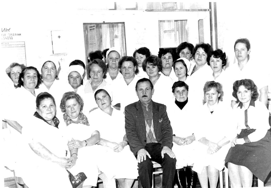
Коллектив банно-прачечного комбината, 1980 г.

В 1979 году в коллективе работало 55 человек, из них 40 человек – ударники коммунистического труда. Взятые социалистические обязательства рабочими комбината выполнялись, ежеквартально комбинат получал переходящий вымпел за I место.