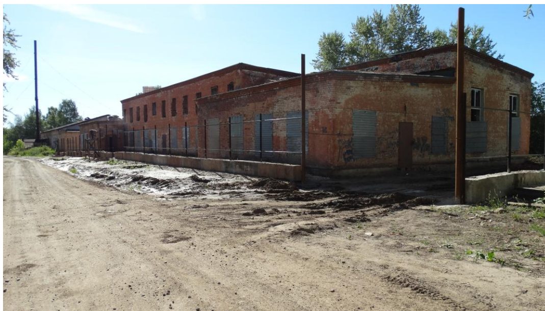
Так выглядит здание банно-прачечного комбината в 2016 году.

25 декабря 1963 года приступили к работе в новом здании. Этот день стал отмечаться как день рождения банно-прачечного комбината.