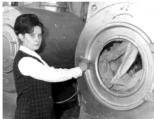
Барабан для сушки белья.

В 1979 году производительность цеха прачечной в смену - 1730 кг сухого белья, цеха химчистки - 130 кг, швейного цеха - 147 штук среднего ремонта.