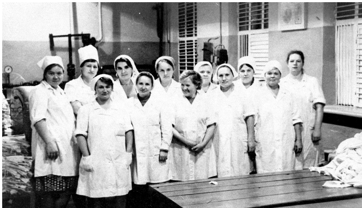
Сушильно –гладильный цех, 1970 г.

Пропускная способность бани - в час 50 человек. В 1979 году построено еще одно отделение на 40 человек. Для населения предоставлялась гарнизонная баня один раз в неделю по субботам с 12 до 20 часов.