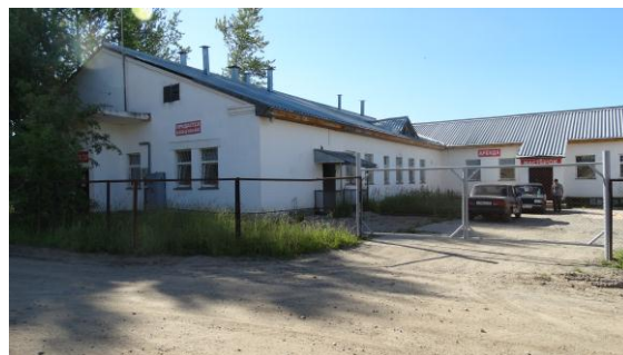
2016 год. Здание продается. Часть здания сдана в аренду.