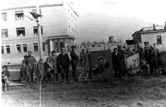
На майской демонстрации, ...г.

Коллектив был дружный. С хорошим настроением работники БПК выходили на демонстрацию.