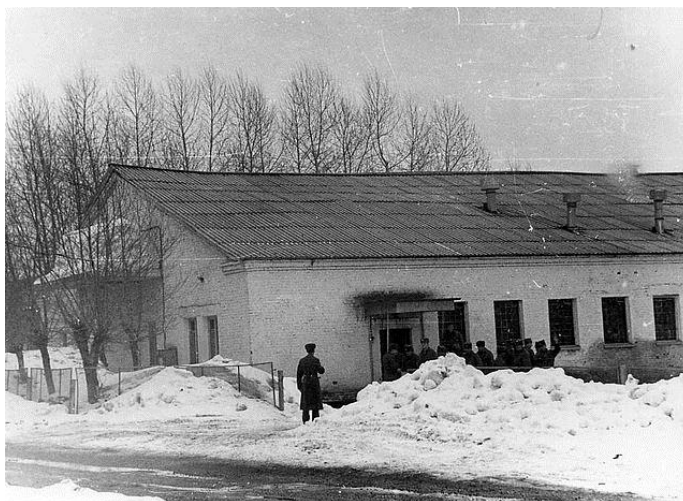
Гарнизонная баня. 70-80 гг.