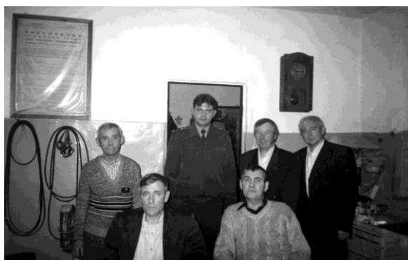
Слесарное отделение, 2003 г.