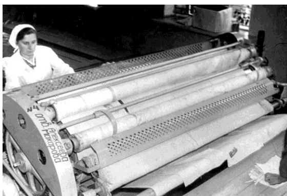
Каландр для сушки белья, 1971 г.

Труд на данном предприятии – это труд физический, связанный с машинами, водой и паром. Гладильщицы всю смену стоят у каландров, сушильщицы – у барабанов. Они стирают, сушат, гладят, чистят и штопают белье и обмундирование.