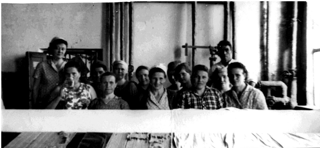
В прачечном цехе, гладильное отделение, 1966 г.

«Гарнизонный бытовой комбинат располагал четырьмя цехами: цех прачечной, цех химчистки, цех по ремонту белья и гарнизонная баня.