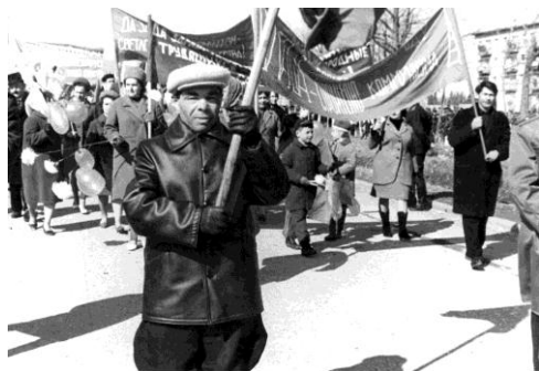
Коллектив БПК на демонстрации