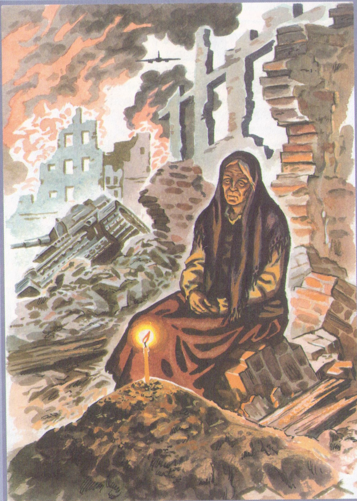
К. СИМОНОВ «Свеча»