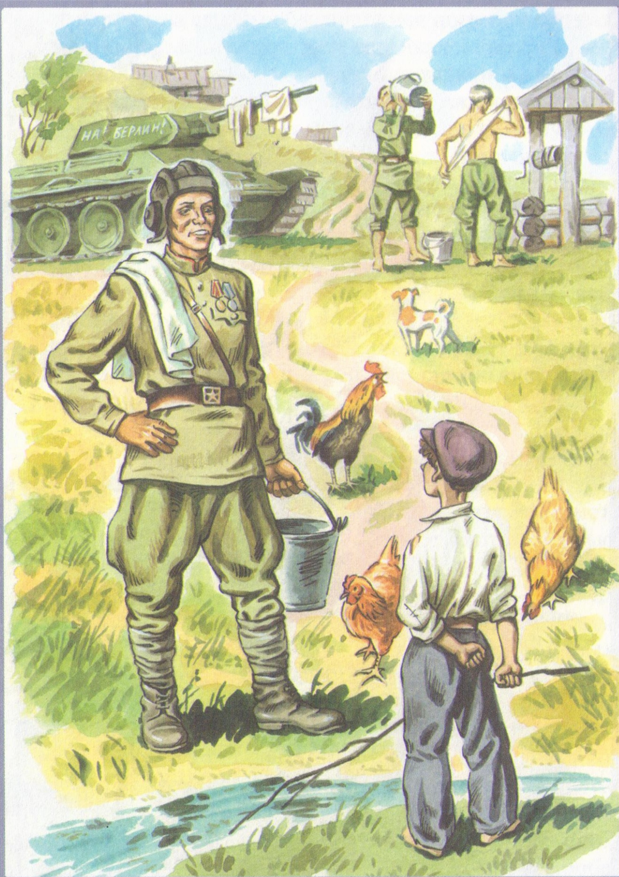
Р. Погодин «Послевоенный суп»