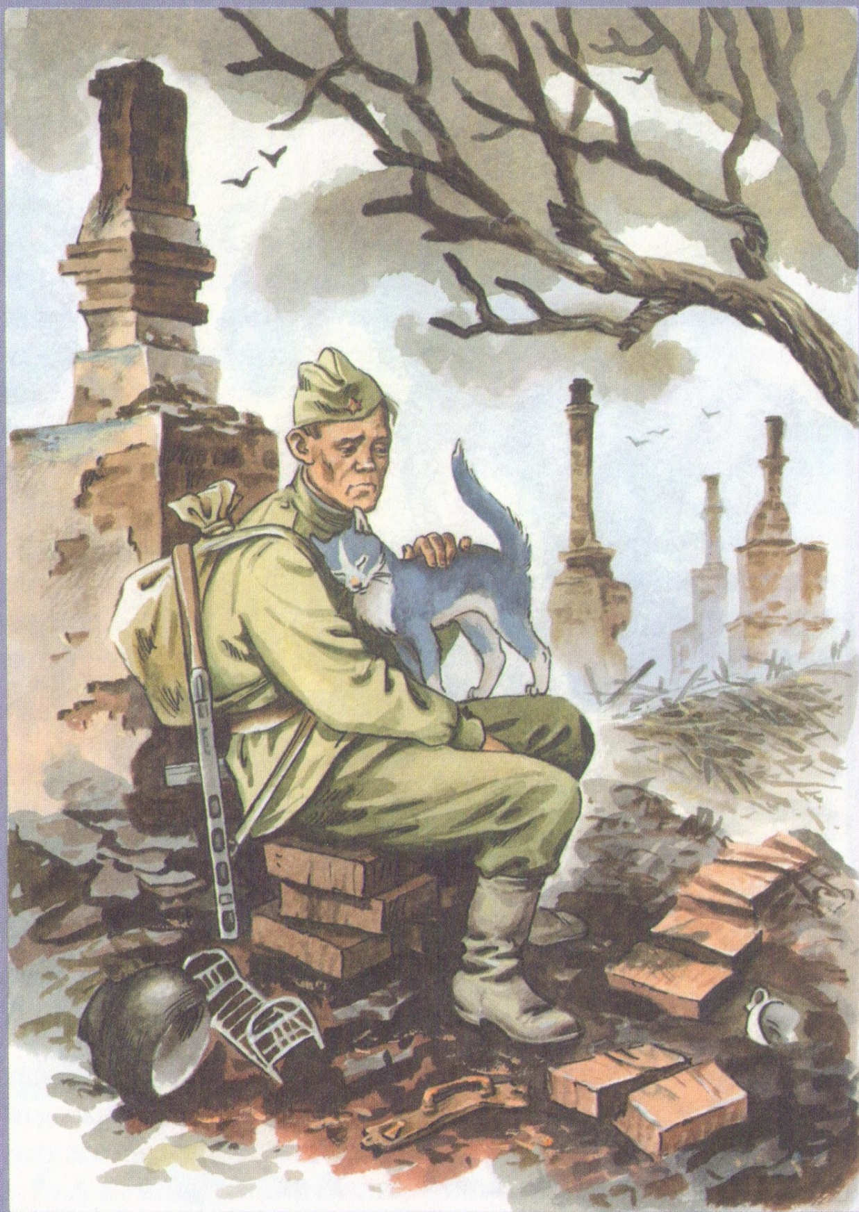
А. Митяев «Отпуск на четыре часа»