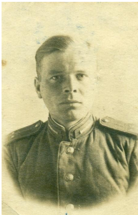
Бершеть, 1944 г.